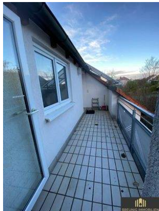
Freisitz / Gemeinschaftseigentum