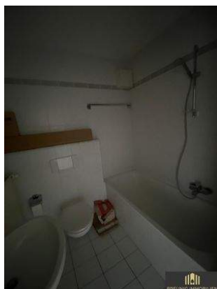
Bad mit WC