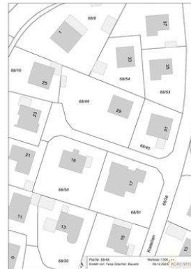
Lageplan Flst.Nr. 68_46 Kratellen 29.jpg