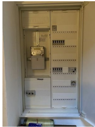
Sicherungskasten mit FI-Schalter