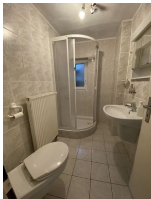
Dusche mit WC und Fenster