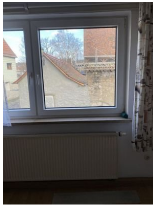
Fenster und Heizkörper