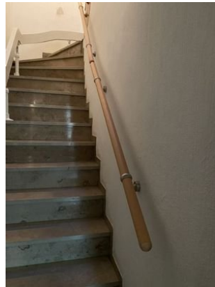
Natursteintreppe EG zu OG