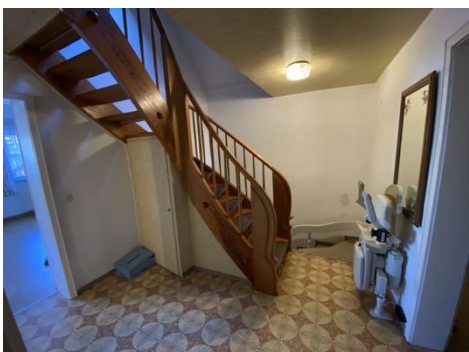
Flur mit Treppenaufgang DG